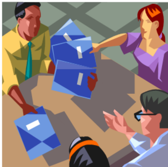
Figuur 3 De taakcultuur

De werknemers werken dan ook vaak samen in wisselende taakgroepen. De structuur die hierbij hoort, is die van de project- en/of matrixorganisatie . Harrison spreekt van netwerken . Op de snijpunten zitten de medewerkers die enerzijds verbonden zijn met de functionele afdeling waaruit ze afkomstig zijn en anderzijds met de projectgroep waarvan ze deel uitmaken (zie figuur 3).