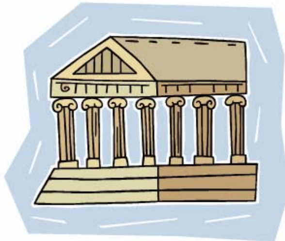
Figuur 2 De rolcultuur

Harrison spreekt van rolcultuur en gebruikt het beeld van de Griekse tempel om de structuur daarvan aan te duiden (zie figuur 2).