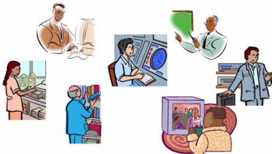
Figuur 4 De individucultuur

De werknemers zijn typische individualisten die hun creativiteit willen botvieren, vrij willen zijn en weinig binding hebben met de organisatie als geheel. Wel met andere individuen, maar dan op grond van persoonlijke voorkeuren.